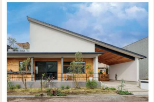
視察② 【Afternoon Tea HOUSE】