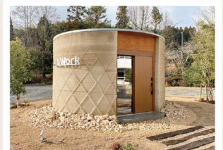
視察④ 【Lib Earth House】