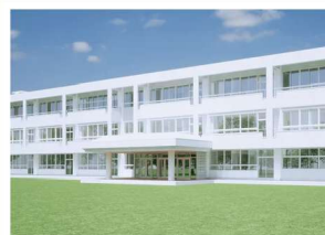
視察③ 【LibWork Lab】